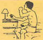
Se despierta de noche

Número de flujo espiratorio máximo al _____